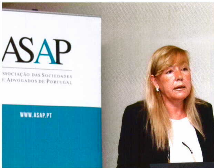
A ministra da Justiça, Paula Teixeira da Cruz